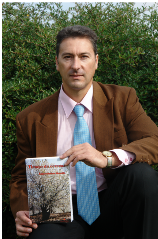
Tiempo de cerezas, una novela muy especial.